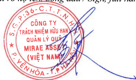
Soh Jin Wook

(Ký, ghi rõ họ tên, đóng dấu / Sign, full name, sealed)