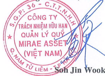
Son Jin Wook