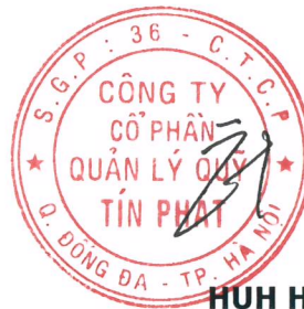
HUH HONG SUK