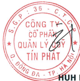
HUH HONG SUK