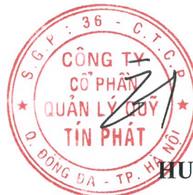
HUH HONG SUK